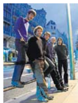
El grupo madrileño, Vetusta Morla.