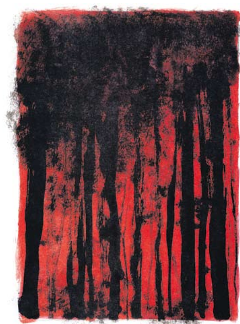
Ilustración de Louis Joos que acompaña al poema de Verlaine, 'En el bosque'.

Ese esfuerzo y entrega física al papel, debe ser preparada, por eso comenta que normalmente para hablar de su ímpetu suele hacerlo en términos deportivos cuando se refiere a