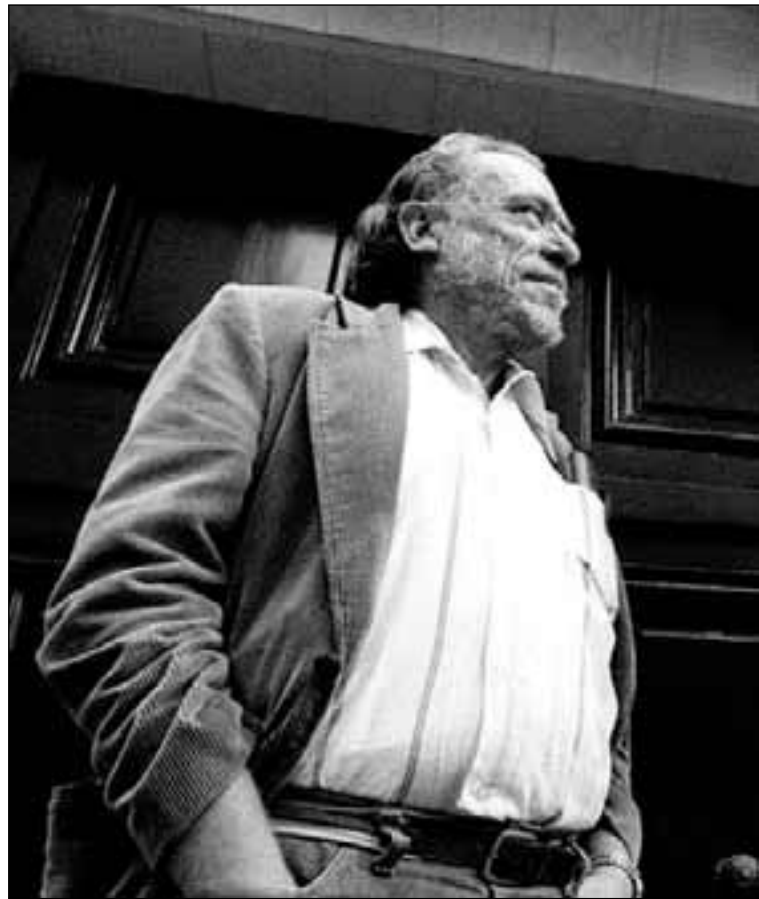
El poeta estadounidense Charles Bukowski. L. O.

A pesar de que se trata de un escrito de juventud, 'Secuelas a una larguísima nota de rechazo' enuncia los motivos y resortes canalleros que acompañaron el grueso de la obra de Bukowski, un autor que casi siempre salió más airoso de la desdicha que de la felicidad incipiente. Al igual que ocurre con sus poemas, resulta más genuino y torrencial en la etapa en la que no se le había revelado la fórmula del éxito y casi nunca pretendía imitarse a sí mismo, como ocurre en sus últimos escritos. De rechazo sabe mucho este cuento, aunque, no la edición, cuidada hasta el extremo. Tanto que da la sensación de responder al deseo del propio autor estadounidense, feliz, a buen seguro, con la alianza póstuma con Müller. ✱