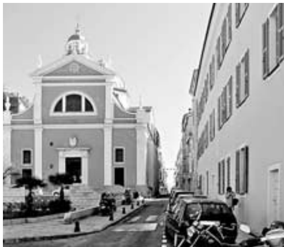
Vista de Ajaccio, uno de los ejes del periplo corso inacabado de Sebald

El lector podrá encontrar un ensayo relativo al descuido lamentable de la literatura alemana para con el registro de las devastadoras consecuencias de los bombardeos aliados sobre las ciudades de su país en la Segunda Guerra Mundial, uno de sus asuntos favoritos, y que bien podría incorporarse a su libro Sobre la historia natural de la destrucción . Los textos sobre la valentía de la escritura de Peter Weiss y Jean Améry ahondan en una línea