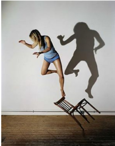
Bram Stroker's Chair IV, de Sam Taylor Wood.