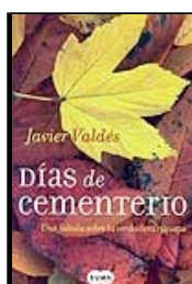
J. Valdés Días de cementerio Suma