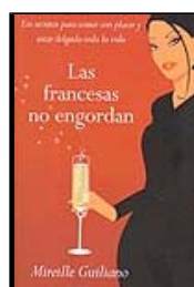
M. Giuliano Las francesas no engordan Vergara